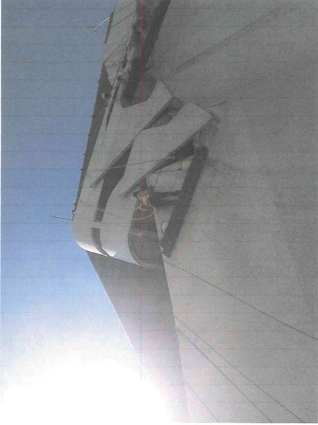
Desinfección de la tesela blanca antes de la limpieza en el sector B2.