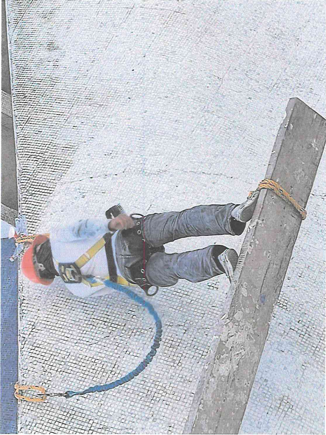
Limpieza de tesela en sector B2 con Cepillo y anti sarro.