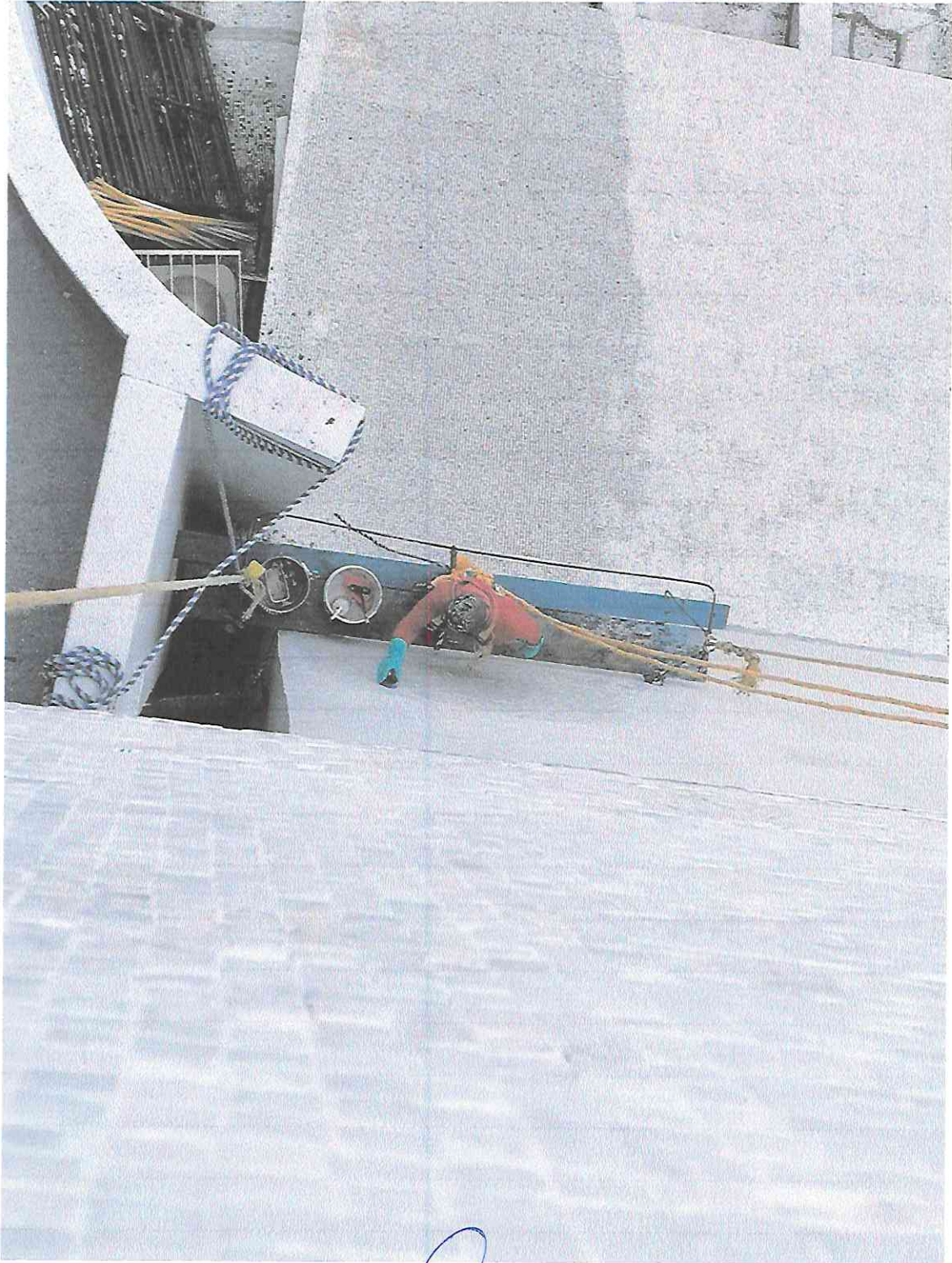
Limpieza de tesela en la parte inferior del sector B2.